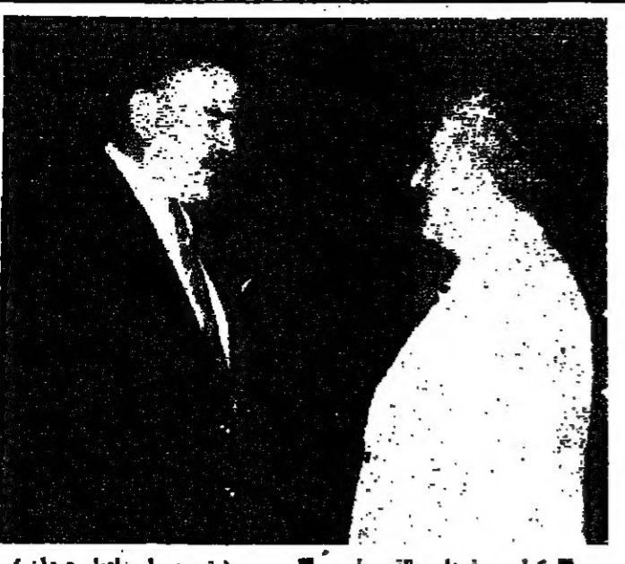
كرامي وغولفي بقصر أمس